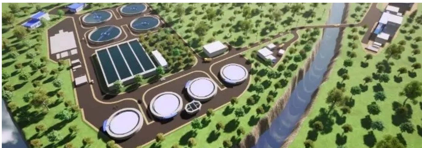
Planta de Tratamiento de Aguas Residuales para el servicio de Pereira y Dosquebradas.

La búsqueda de fuentes de financiación para asegurar la ejecución