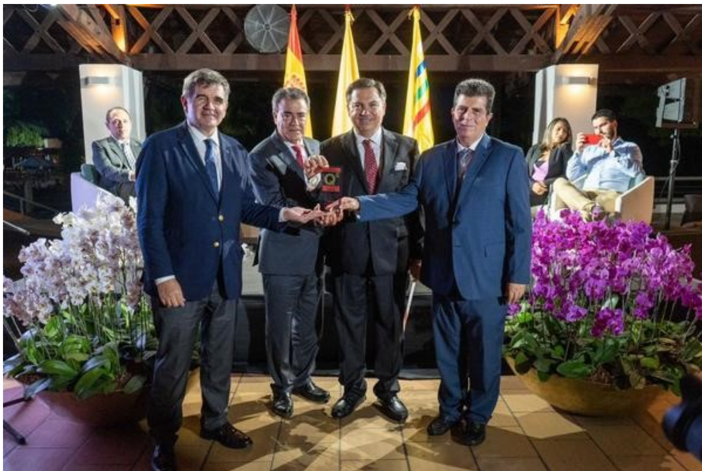
La Universidad Tecnológica de Pereira recibió la certificación internacional "Sello Sofía", ampliamente reconocido en Europa.