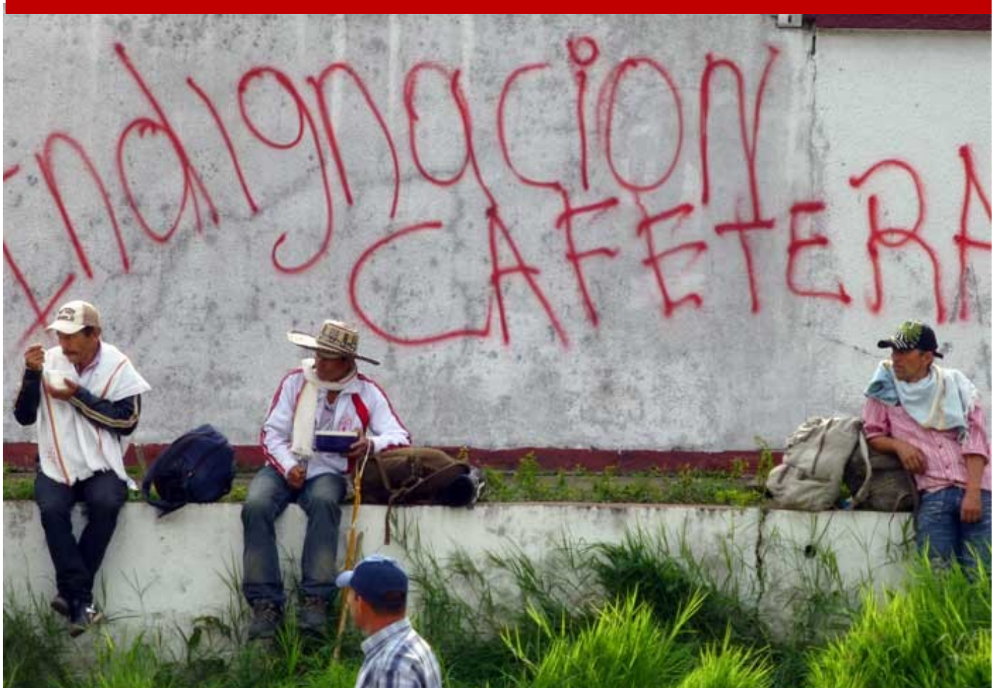
Los caficultores del Huila son muy pobres y con frecuencia reclaman de las autoridades cafeteras y del gobierno nacional una mayor atención.