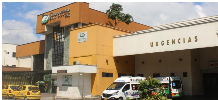
Una auditoría forense aclararía la situación financiera y, administrativa y operativa del hospital San Jorge de Pereira.