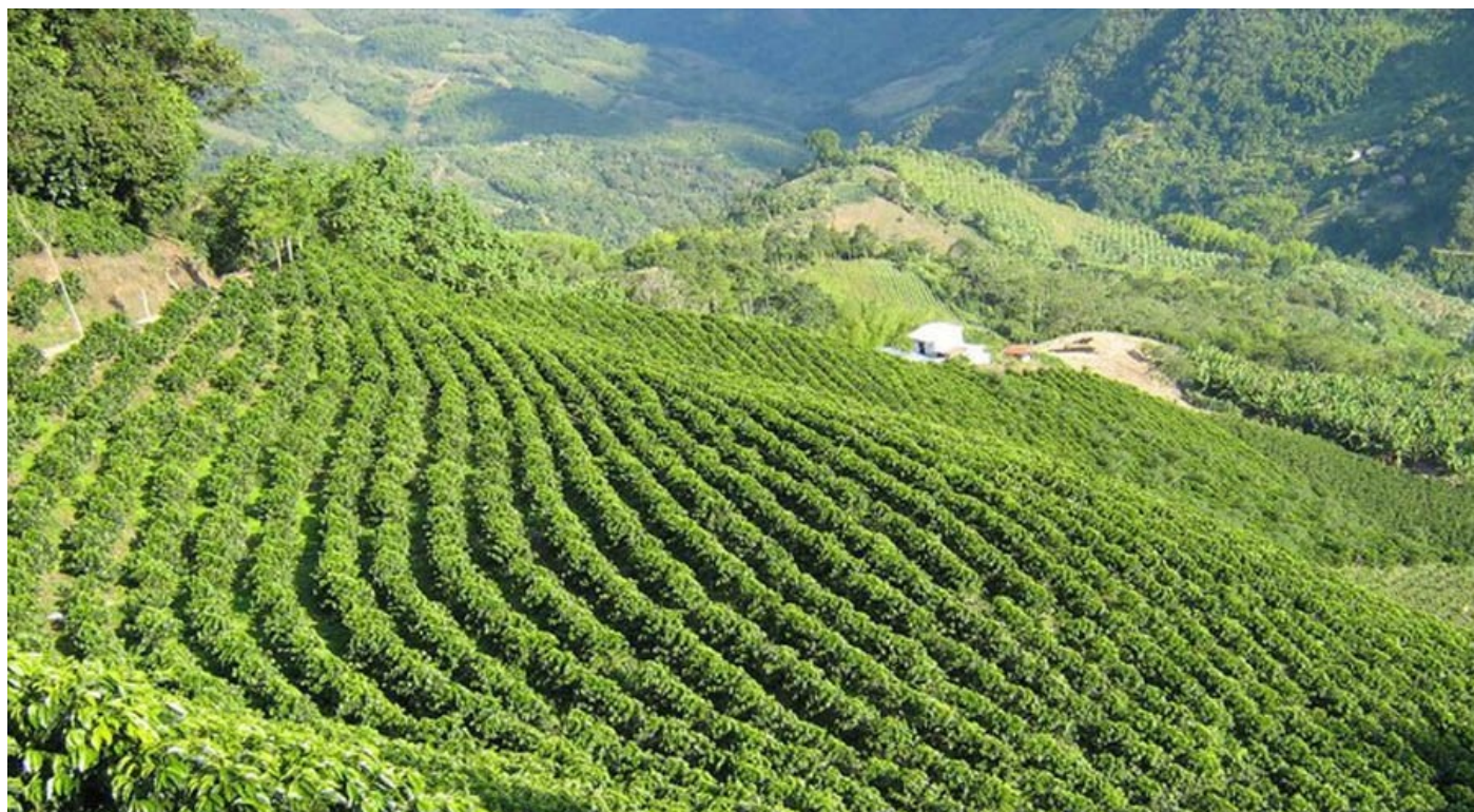
Los beneficios de la siembra del café no llegan a los productores en departamento del Huila, cuyos niveles de pobreza son muy altos.

El eje cafetero colombiano está ubicado entre las montañas y los valles, donde la economía palpita, la gente impulsa el desarrollo y hay conexiones con el mundo, que hacen atractiva esta tierra, donde más de dos millones de personas son orgullosas de su pasado y trabajan para que la historia, las costumbres, la música y la cultura, sigan siendo el pegamento que los han convertido en un ejemplo nacional.