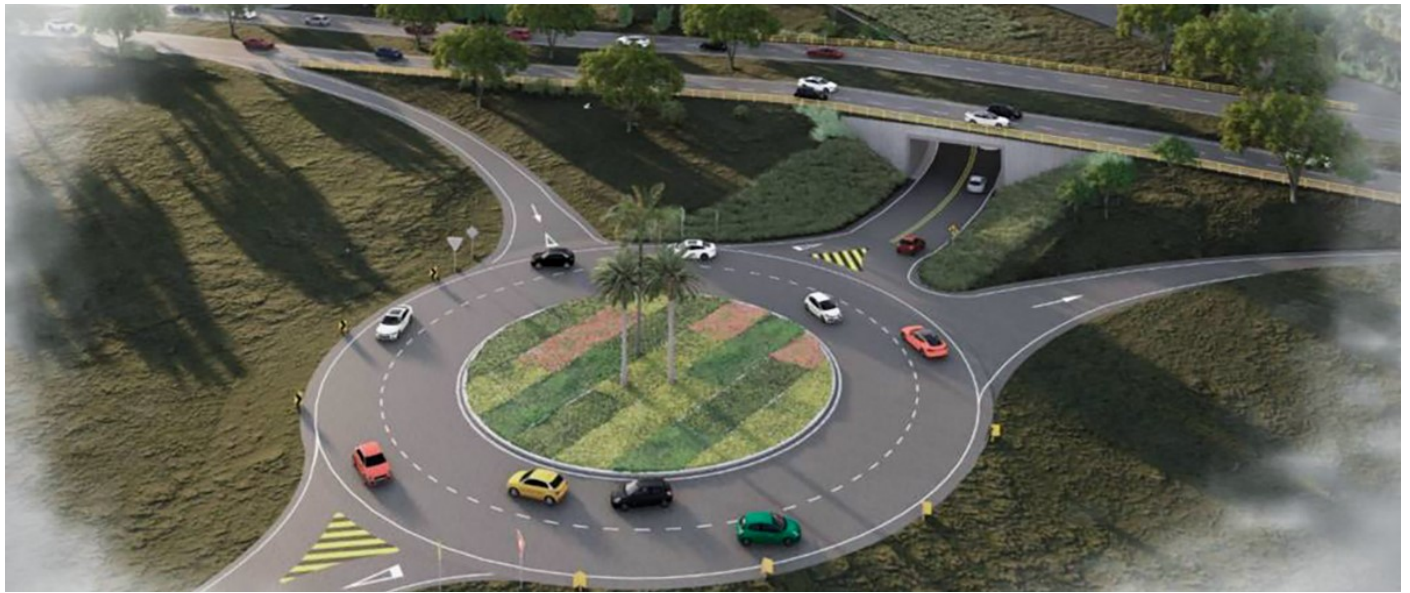
Intersección vial en el sector de Galicia, una de las áreas suburbanas con mayor crecimiento poblacional en Pereira.