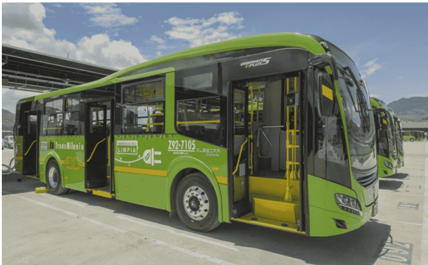
Un total de 229 buses eléctricos entraron en operación en la ciudad de Bogotá. 112 buses con capacidad para 80 pasajeros y 117 para 50 pasajeros.