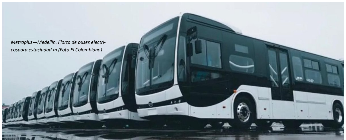
Metroplus—Medellin. Flota de buses electricos para estaciudad.m

* Subgerente de COTE & ECHEVERRI S.A.S. - Estructuración y Gerencia de Proyectos